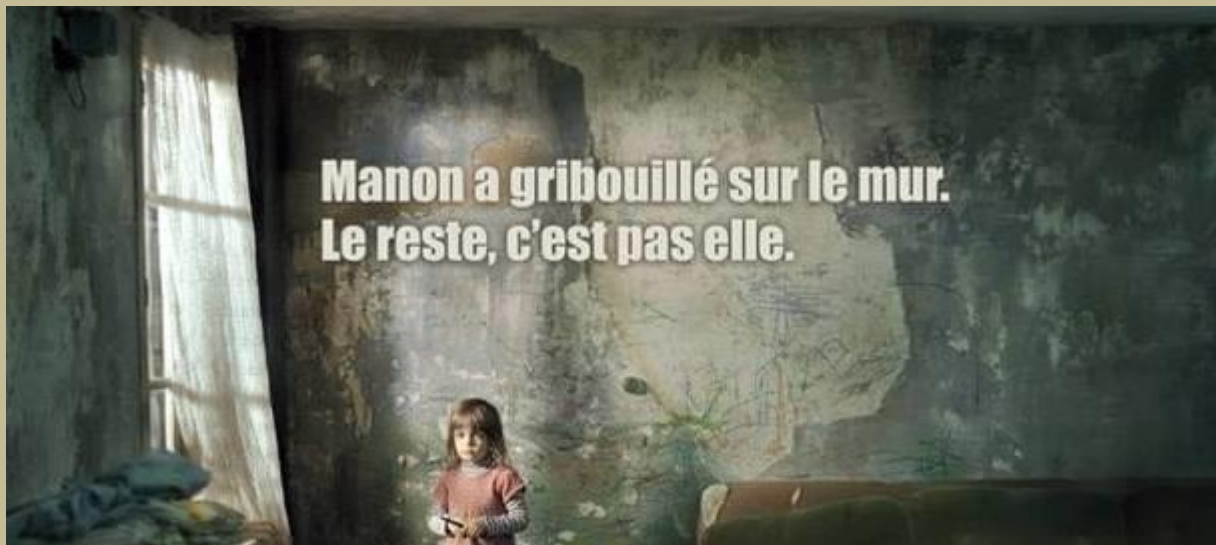
Affiche diffusée par la Fondation Abbé Pierre

POINT D'EAU est un accueil de jour pour personnes en grande précarité sociale et / ou sans domicile fixe. Nous sommes à la fois un lieu de vie et d'accueil où sont proposés de multiples services considérés comme des étapes clefs vers la dignité et la restauration de l'estime de soi .